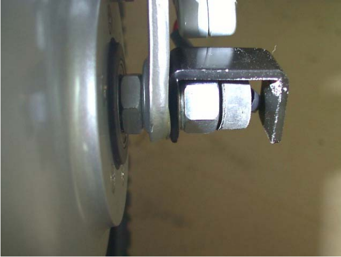
Foto 2. Forhjul, el-siden. Set indefra: hjulaksel, forgaffel, stor skive, beslag, skiver, spændebolt og gummiprop ( aftages ikke ).