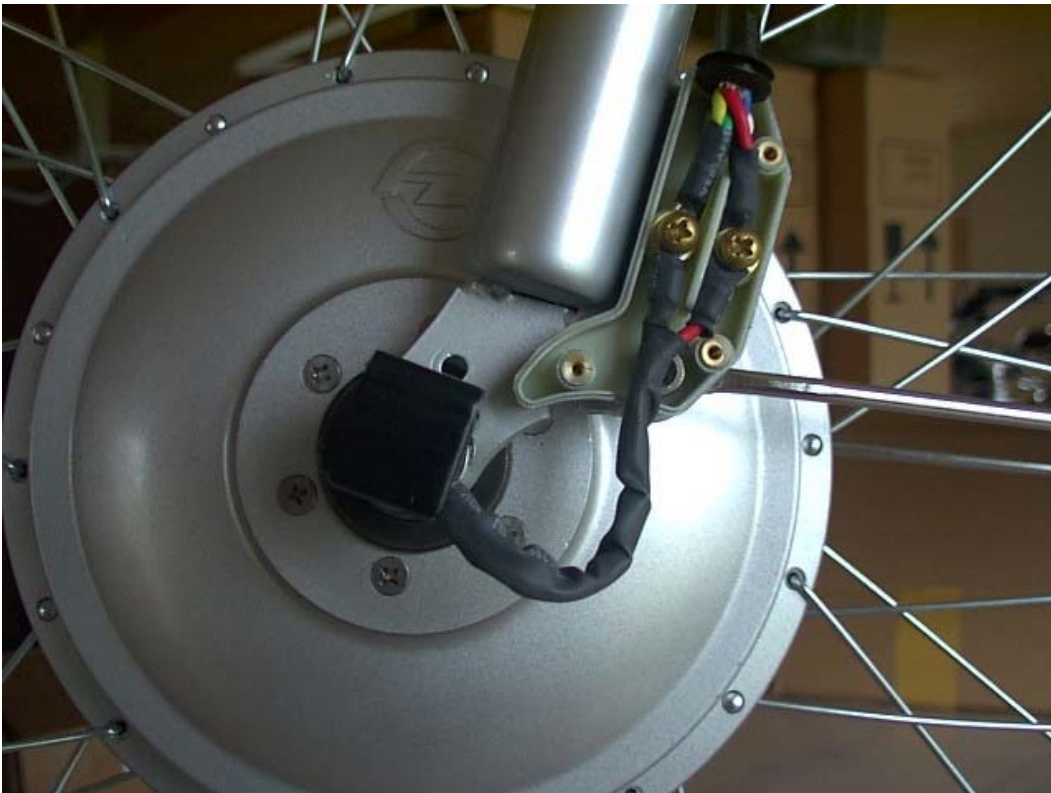
Foto 1. Korrekt monteret el-forbindelse (forsigtig eftermontering af plastdæksel og gummikappe). Visse modeller har fast stik. Bemærk tillige den sorte metalbøjle, til beskyttelse af ledningsudgang fra motor (alle modeller).

Husk herefter jævnligt at checke bremsen og eftergå el-cyklen for evt. løse bolte og skruer m.m. samt sørge for at batteriet altid er fuldopladet. Om vinteren opbevares batteriet frostfrit og oplades min. 1 x hver måned, i perioder hvor du evt. ikke bruger cyklen.